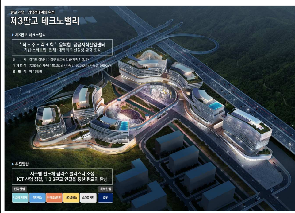
제3판교 테크노밸리 조감도(안)